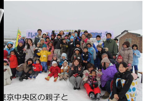
東京中央区の親子と いっしょに雪遊び

クリエイトひがしねはタントクルセンターを拠点にして、地域に根ざした「希望と輝きのあるひがしね」を発信していきます