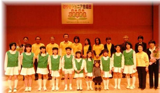
ジュニアけやき合唱団の結成と育成に力を注いでいます。「春風コンサート」を終えて