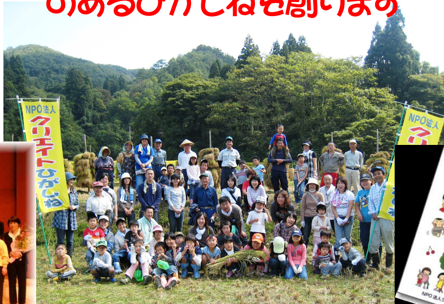
沼沢地区の皆さんの協力を得ての「親子あそびの学校」稲刈りを終えて記念撮影