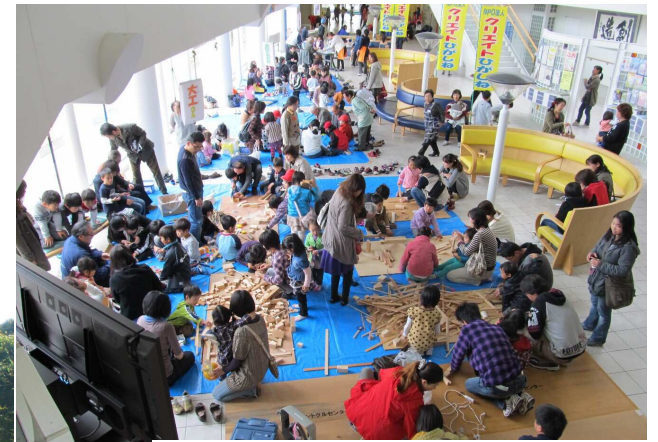
老人クラブの協力で「じいちゃんばあちゃんいっしょにあそぶべ」