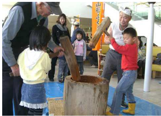
地域の伝統行事である「餅つき」を伝授